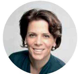
אלכסנדרה פאלט סגנית נשיא בכירה לקיימות וסגנית נשיא קרן לוריאל

"משנת 2013, השנה בה השקנו את התוכנית הראשונה שלנו לפיתוח בר-קיימא, העולם השתנה. היקף האתגרים העומדים בפנינו הוא חסר תקדים. השאיפות שלנו חייבות לעלות בקנה אחד עם האתגרים האלה. אנחנו לא רק צריכים להשתפר, אנו חייבים לעשות את מה שצריך."